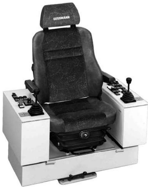
Заказное обозначение KST51KFS92-...

Поворотный пульт управления KST 5 выполнен согласно эргономическим рекомендациям и отвечает высоким требованиям комфорта.