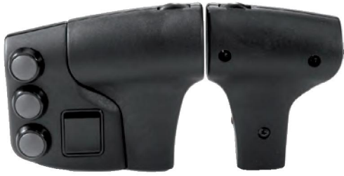
Заказное обозначение В10.1-13DW-...

Фасонная рукоятка В 10-1 является элементом переключения для двойных рычажных командоконтроллеров фирмы ГЕССМАНН типа D 64, DD 64, D 8. Рукоятка В 10-1 имеет левое исполнение, а рукоятка В 10-2 - правое. Рукоятки В 10 также могут применяться в качестве элемента переключения для гидравлических приводов. Возможность установки различных устройств подачи команд, таких, как нажимные выключатели, нажимные позиционные переключатели и т.д., позволяет приспосабливать рукоятку переключения к соответствующим требованиям заказчика.